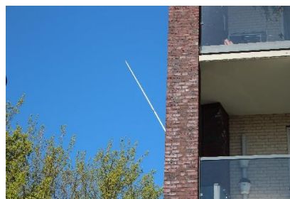
Deed het beter als het sprietje