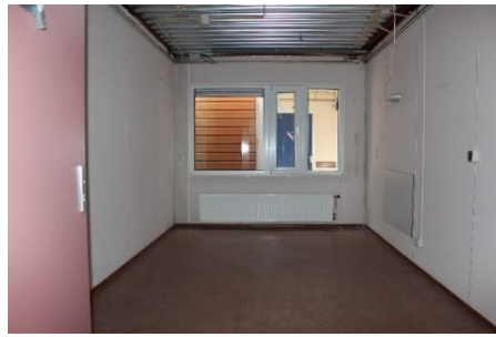
Gezien vanaf de achterkant en 6 mtr diep Gezien door het raam naar de achteruitgang