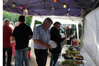
Als hongerige leeuwen