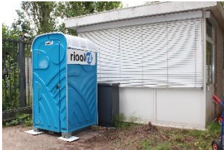
Ons gesponsorde Luxe toilet

Het grandioze jubileum en de BBQ van het 40 jarig bestaan van de VRZA Afd: KAGERLAND PI4KGL op 17 aug. op de zendlocatie in OEGSTGEEST. Uiteindelijk op de avond, 5 leden van het landelijk VRZA bestuur, 47 afdelingsleden en 3 afdelingsleden van de Veron Afd: Leiden.