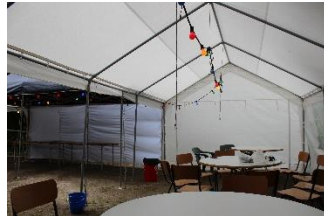
Opbouw van de tenten