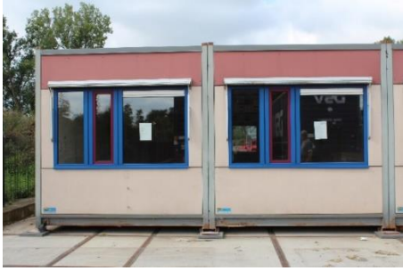
2 Cabins geschakeld totaal 6 mtr breed