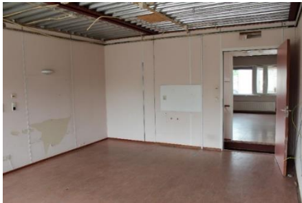
Dit zijn 2 x 1,5 cabin met tussenwand links en rechts