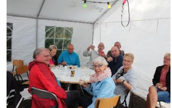
En relaxed een drankje

Eindelijk was het dan zover, op zaterdag 17 aug zou het gaan gebeuren. Na het braamstruik en onkruid vrij maken van het terrein, dank mannen en vrouwen voor jullie tomeloze inzet, kon er begonnen worden met het opzetten van de tenten. Voor de zaterdag was de weersvoorspelling niet zo best, maar het lukte om de tenten droog op te zetten. Dat was maar gelukkig ook, want in de nacht van vrijdag op zaterdag en de zaterdag ochtend vielen er heel veel emmertjes naar beneden. In de middag is het opgeknapt en is het droog gebleven.